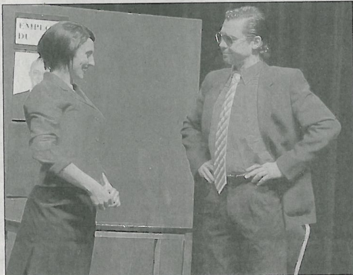
Jean-Luc Beche, coach d'entreprise, prétentieux fanfaron et dragueur.

ne, une dirigeante dévorée par l'ambition et qui abuse de son pouvoir sur José et Robert. Prêts à tout pour gagner du galon, les deux cadres rivalisent de dévouement et de zèle pour satisfaire les moindres désirs de leur supérieure. Jusqu'à l'arrivée de Jean-Luc Beche, coach d'entreprise, prétentieux fanfaron et dragueur.