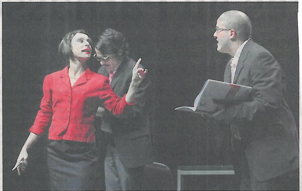
La vie de bureau...

C'est toute la panoplie du registre burlesque que vont développer les comédiens de la Cie Brainstorming pour brosser, à leur manière, les dérives de l'entreprise moderne. Celle qui, pour arriver à ses fins, s'acquitte de toute espèce d'humanité.