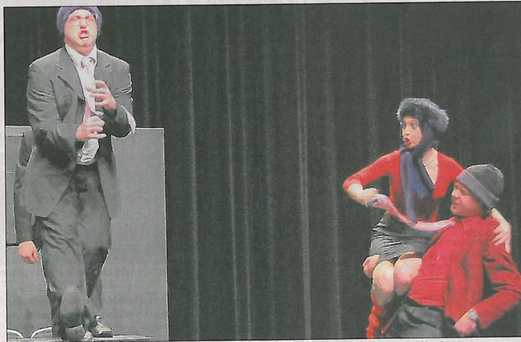
Les comédiens de la Brainstorming Compagnie s'en sont donnés à cœur joie, samedi soir.